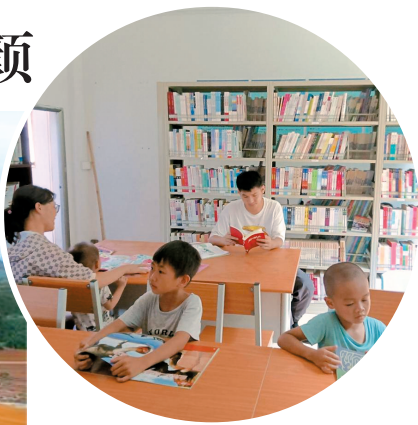
▲小湾村乡村文化空间阵地。

小湾村积极实践农村综合改革,通过“三地”土地整合模式(菜园地、机动地、流转地),统一思想认识,将“发展产业、壮大经济、建设新村”作为发