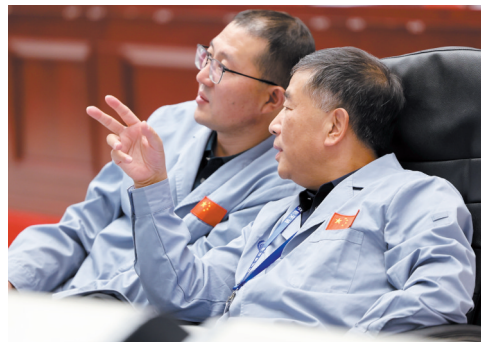
■6月6日,在北京航天飞行控制中心,嫦娥六号任务总设计师胡浩(右)和探月与航天工程中心主任任锋在交流交会对接进展情况。