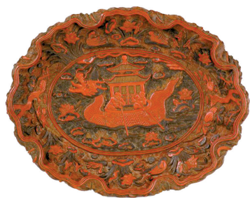
▲剔彩龙舟图荷叶式盘

盘造型为仿生变化而成,是当时的创新。装饰内容丰富,主次分明,花纹细密,漆色沉稳,雕刻不藏锋,这是嘉靖朝官作雕漆器的特点。