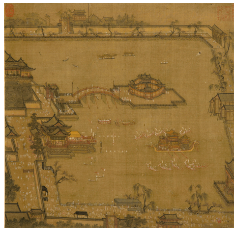
宋 张择端(款) 《金明池争标图页》 天津博物馆