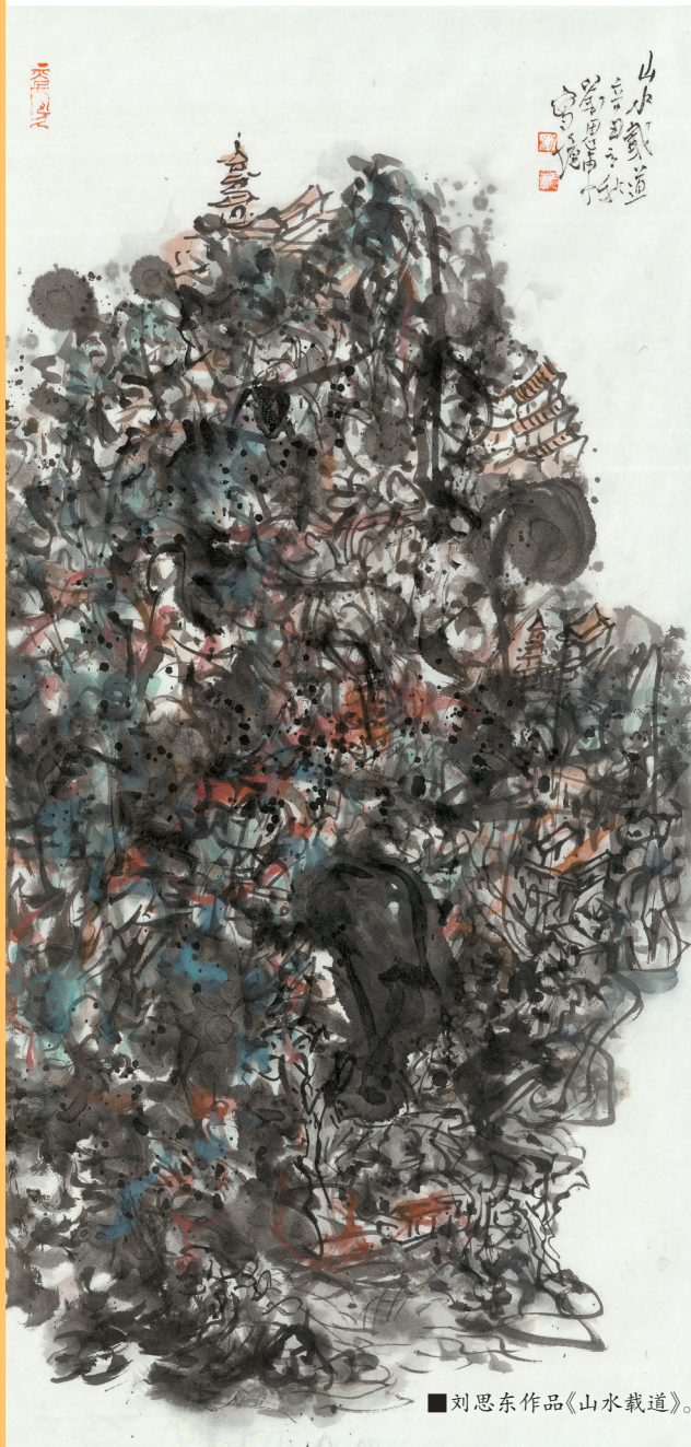
■刘思东作品《山水载道》。