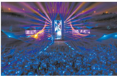
■广州美术学院2024毕业季光影秀现场

场视觉之旅,更是一场美学思想的洗礼。它独特而巧妙地将历史、人文、科技、未来等元素融为一体,塑造了一个迷人绚丽的艺术世界,展现了广美学子们在艺术创作上的卓越成就,更折射出他们对社会、生活和未来的深邃思考与美好期许。