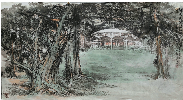
■胡江《华工蒙古包》, 97×180cm, 2024

开幕当天,胡江向天河区政协捐赠了自己创作的艺术作品《宏泽四海》。画展举办的同时还举办了主题为“城市景观主题绘画与山水画意境