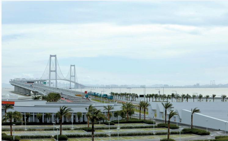
■深中通道将于6月30日下午3时正式通车试运营。届时,广州南沙至深圳的行程将缩短至20分钟。

据介绍,深中通道全线车辆通行费收费标准为每标准车次66元。通车后,深中通道还将严格执行国家和广东省出台的一系列优惠政策和措施,包括重大节假日7座及以下小客车免收通行费、鲜活农产品运输“绿色通道”免费、ETC车辆通行费9.5折等。