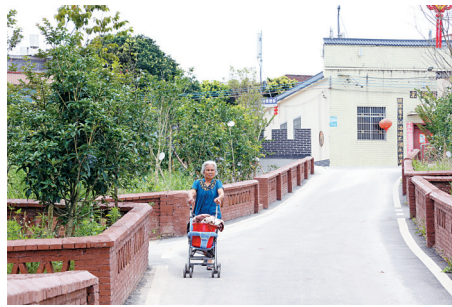
■土陂冲村颜值提升，更加宜居宜业宜游。