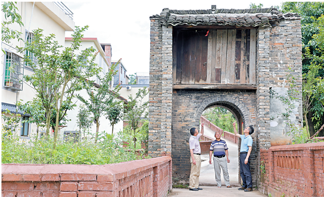
■一座上百历史的门楼，立于栽满桂花、紫薇、樱花的小花园间，打开了通往“诗与远方”的大门。