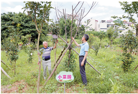
■土陂冲村的村民在自家宅前屋后开展“小花园、小菜园、小果园”建设，不断提升乡村颜值。