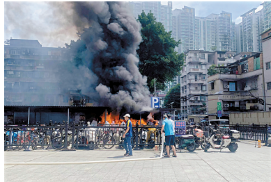
■骑手小哥帮忙灭火。受访者供图

新快报讯 见习记者陈洁报道 6月28日上午,广州市海珠区富基广场A区一电动自行车停车棚突然起火,现场火势较大,浓烟滚滚。火情在几分钟内得到控制,初步估算有近20辆电动自行车被烧毁,事故未造成人员伤亡。 小区物业工作人员告诉记者,上午10时30分左右,他正在值班,发现火情后立刻上报情况,保安、消防、城管、居委、安监都第一时间赶到现场参与救火,初步估算有近20辆电动自行车被烧。 广州市消防救援支队通报称,主要燃烧物为电动自行车、充电桩及车棚,燃烧面积约6平方米,无人员伤亡。