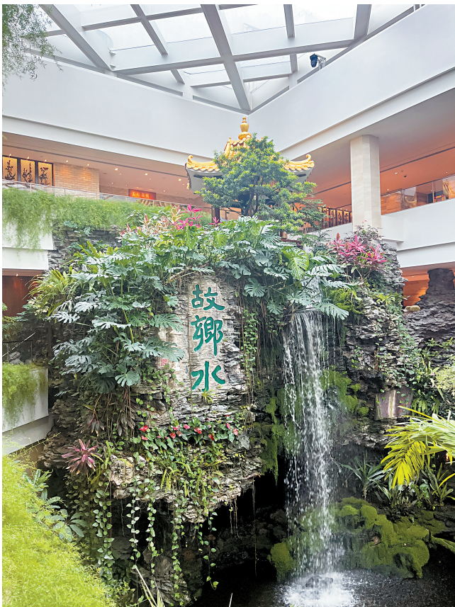
白天鹅宾馆内的高山流水，是外地游客最爱的拍照打卡地。