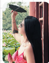
金小姐 80后，教育行业。