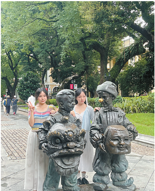
日常，越来越多年轻人喜欢到沙面打卡。