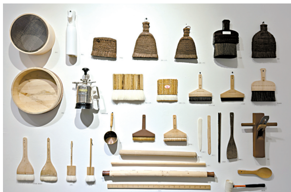
传统书画保存与修复专业所用到的部分工具