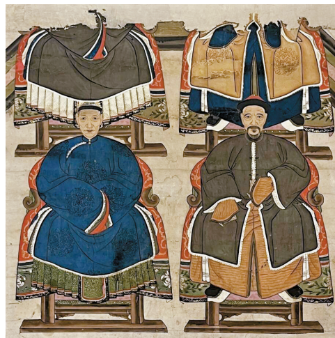
《个人藏 宗族肖像》-修复轴装 修复后