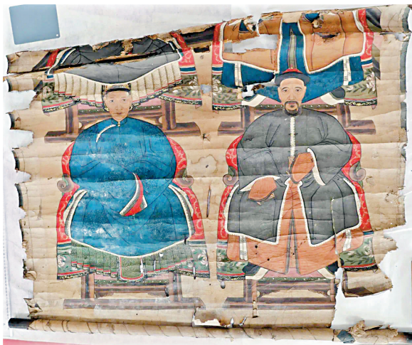
《个人藏 宗族肖像》-修复轴装 修复前

毕业生朱含月回忆起过往半年的工作状态,“每天准备着手画之前基本需要较长时间的‘心理建设’,因为一旦进入状态就得全神贯注,整个过程其实挺耗精力的。”她摹写的是敦煌绢画《树下说法图》。尽管她坦言创作过程都很累,但由于她太喜欢这张画,所以“表现的过程都很兴奋。可惜受材料所限,未能把原作的用色厚度还原。”