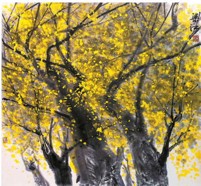
■梁江作品《秋之畅想》110cm×65cm。

也许,未来的发展会证实,儿童在美术活动中对色彩规律的感觉,对形体组合的认知,对空间知觉、视知觉方面的有效训练,可以导致一种远比当画家,远比审美效应重要的能力。这种非同小可的能力便是创造性想象力。用爱因斯坦的话说,想象力是知识进化的源泉,想象力可以概括世界之一切,它是推动进步的。因此,爱因斯坦下了一个断语:“想象力比知识更重要。”