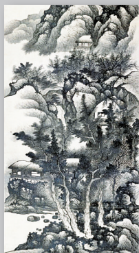
▲(清)龚贤《云山结楼图》局部 广州艺术博物院藏 ▶结合清龚贤《云山结楼图》设计的时装