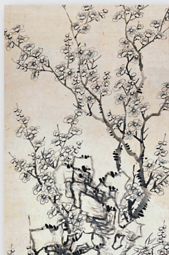
▲(清)金农《竹石寒梅图》局部 广州艺术博物院藏 ▶结合清金农《竹石寒梅图》设计的时装