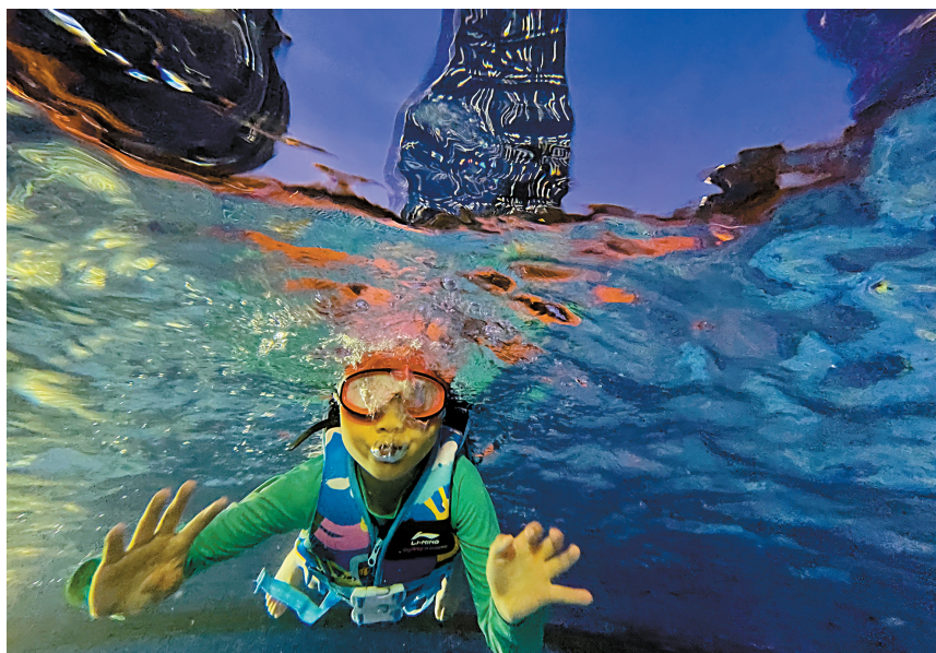
■一个小男孩潜入水底“探险”。