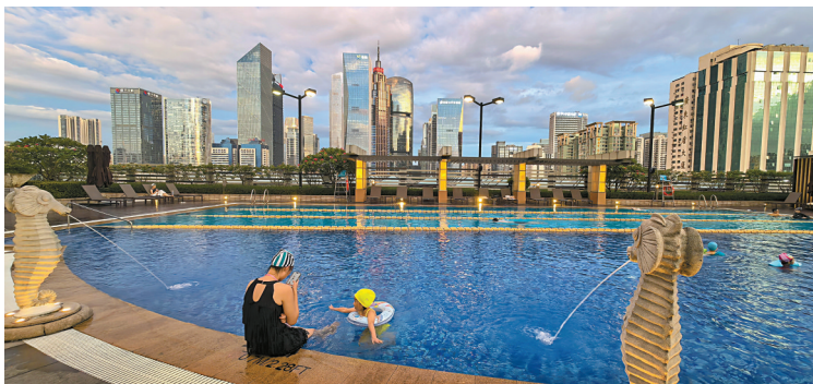
■某酒店泳池,一名母亲带着孩子在玩水,享受惬意的清凉时刻。