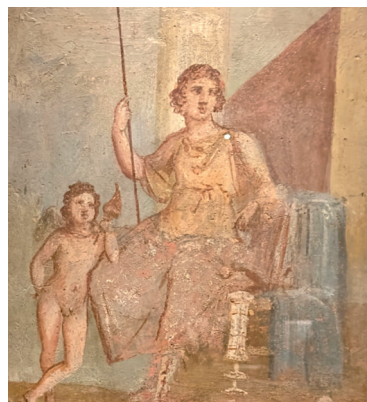
■《宝座上的维纳斯》,湿壁画,绘制于公元1世纪,庞贝遗址出土

代表阳光、温暖和希望的黄色常被用于描绘神话场景以及人物形象;寓意着宁静、深邃与和平的蓝色常被用于描绘天空、海洋等自然元素以及神话中的神祇和英雄人物。展厅中《忒修斯与阿里阿德涅》的湿壁画就通过色彩的运用赋予了人物形象鲜明的个性和情感:以暖黄色为背景色,忒修斯身上采用红色,讲述的是古希腊神话中一个关于爱情、勇敢的故事。