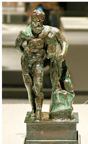
■《正在休息的赫丘利》,庞贝遗址出土