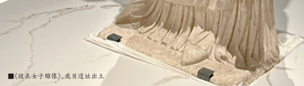
■《披衣女子雕像》,庞贝遗址出土