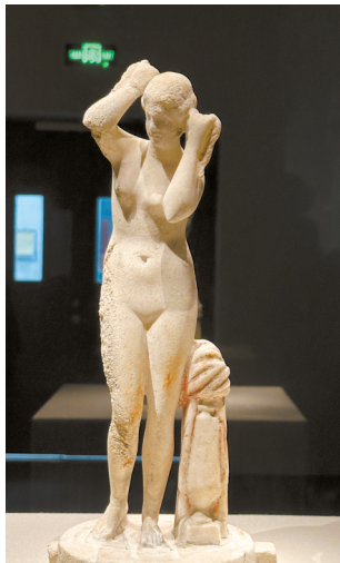
■《维纳斯的诞生》,庞贝遗址出土