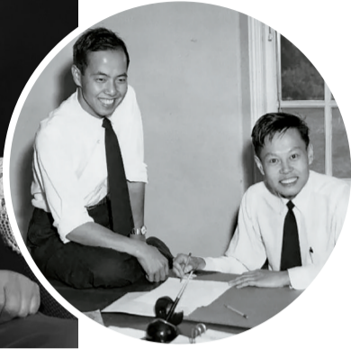
■李政道和杨振宁 1957年在普林斯顿。