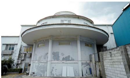
■旧白云机场航站楼东立面原来横竖分格的大面积玻璃窗现已被改成墙体