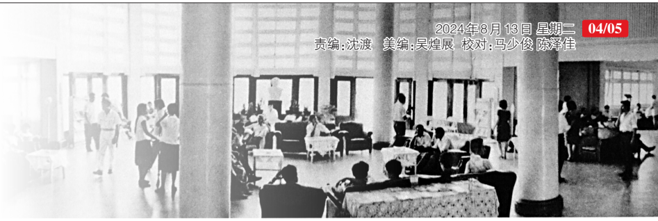
■经过1964年扩建后的旧白云机场航站楼大厅,旅客在内候机。