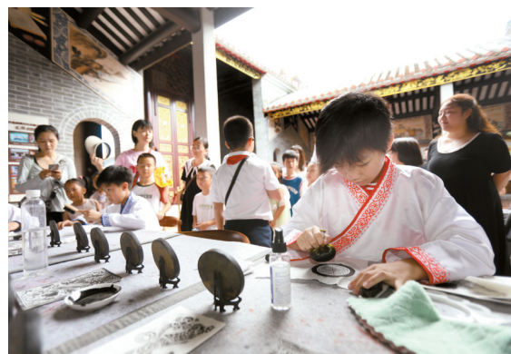
■福元徐公祠现在是学校的图书馆。开学这一天，学校在这里举行醒狮、拓印、投壶等非遗活动，向新同学展示。