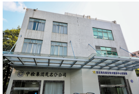
■茂名罗非鱼公共检测服务中心。