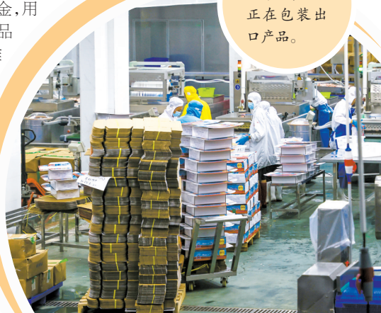
■罗非鱼加工车间,工人正在包装出口产品。

质生产力赋能罗非鱼产业升级提速,不断激发释放区镇村发展活力潜能,努力把罗非鱼打造成富有茂南特色的地标产品,探索形成罗非鱼产业高质量发展的“茂南标准”。