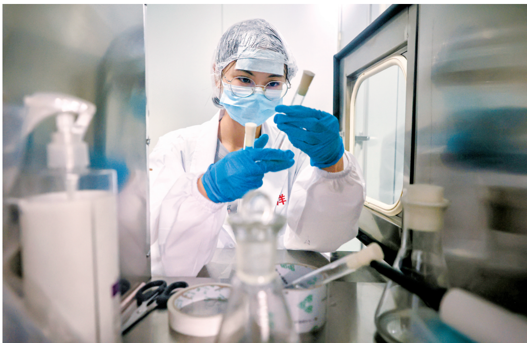
■广东双洋食品科技有限公司化验室,工作人员正在对罗非鱼原料进行自检。