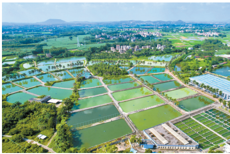
■茂南罗非鱼良种场。