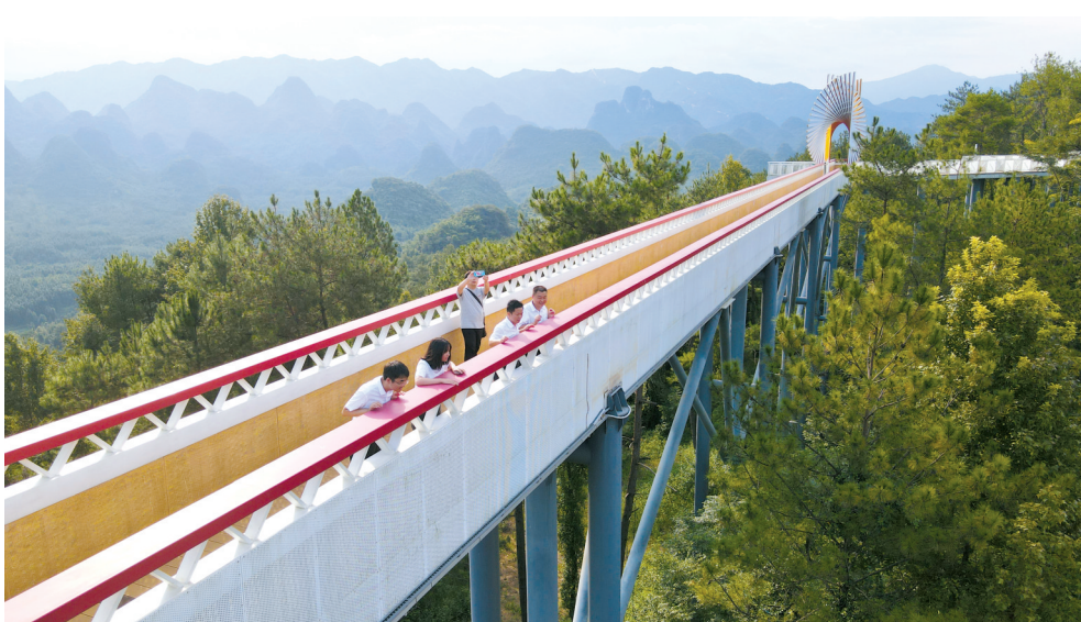
■三排镇云海花谷·万山朝王驿站1314米景观桥变成当地的浪漫网红桥。