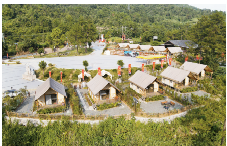
■三排镇云海花谷·万山朝王驿站,一排排帐篷式民宿具备了入住条件。