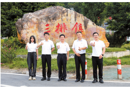
■广州市驻清远连南三排镇工作队合影。