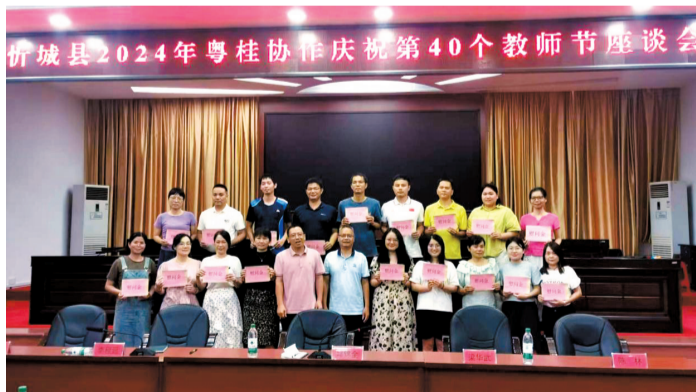
■ 忻城县 召开2024 年粤桂协 作庆祝第 40个教师 节座谈会。

新快报讯 记者朱清海报道 9月9日，广西来宾市忻城县召开2024年粤桂协作庆祝第40个教师节座谈会暨慰问活动，向每一位不远千里到忻城支教的老师献上最真诚的祝福。