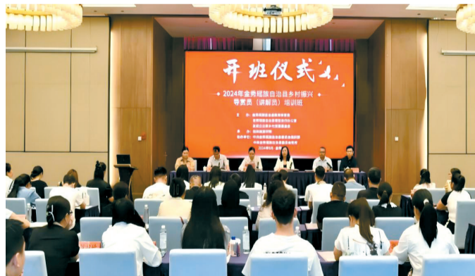
■ 金秀瑶族 自治县乡 村振兴导 赏员（讲 解员）培 训班开班 仪式现场。

新快报讯 记者曾贵真报道 近日，2024年金秀瑶族自治县乡村振兴导赏员（讲解员）培训班顺利开班。广西来宾市金秀瑶族自治县80余名各乡（镇）干部、村干部、青年骨干以及喜爱讲解工作的企业家们参训。