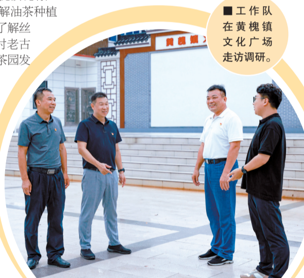
■ 工作队 在黄槐镇 文化广场 走访调研。

工作队表示，乡村振兴任重道远，接下来将充分利用组团单位资源，团结更多社会力量，当好“联络员”“调研员”“指导员”“监督员”和“宣传员”，为黄槐镇乡村振兴贡献更多“天河力量”。