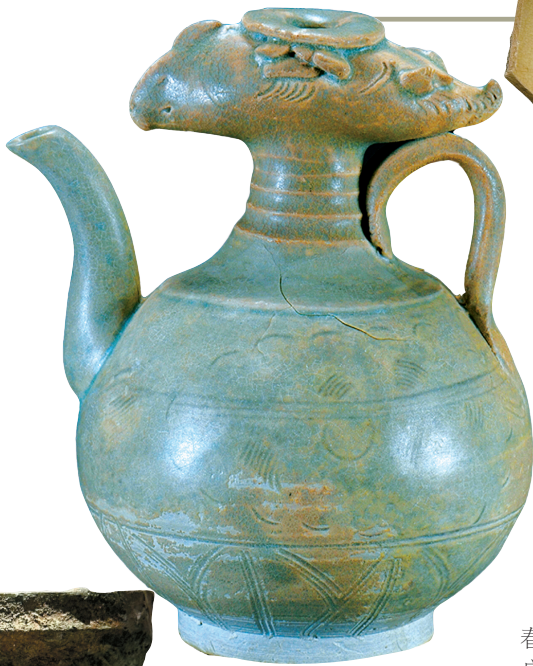
▲西村窑青白釉凤首壶，宋，广州海事博物馆藏。

本次展出的三枚南越木简，其中两枚写的分别是“壶枣一木第九十四 实九百八十六枚”“高平甘枣一木第卅三 实口百廿八枚”。“壶枣”即壶形的大枣，“高平甘枣”是以地方命名的甜枣。“枣主要生长于北方中温带干旱地区，南越国能在湿热多雨的热带地区大规模种植成功，这不但反映了南越国生产管理制度严格，也透露了南越王赵佗对中原故土的思念之情，以及对食枣以祈长生不老追求。”