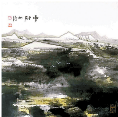
林映涛 夏 38cmx38cm 纸本设色 2024