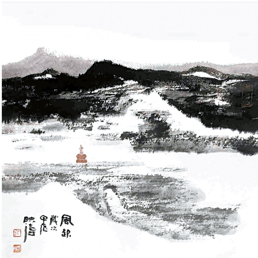
林映涛 风起 38cmx38cm 纸本设色 2024