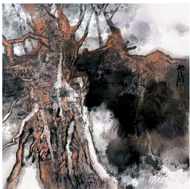
林映涛 相依 38cmx38cm 纸本设色 2024