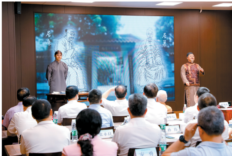
■广州岭南书院·隔山书院开幕式现场。

回看20世纪初,高剑父、高奇峰、陈树人等以“折衷中西,融汇古今”的绘画改革主张,创立了与京派、海派并称“中国画坛三大流派”的岭南画派。岭南画派作为岭南文化的亮丽名片之一,其革新、开放、兼容、务实、创新的精神内涵,也是岭南文化