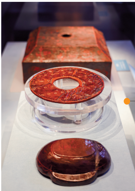
■西汉漆耳杯、漆壁、漆器座