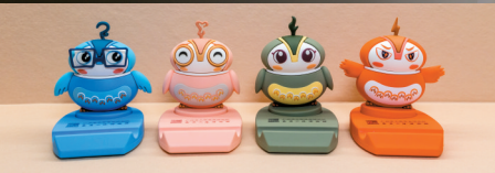
▲由陶鸮形五联罐衍生的文创手机支架