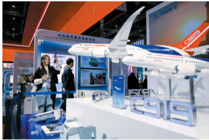
■11月5日,参会者在中国馆拍摄飞机模型。

开放进程。2023年,全球数据市场平台交易量同比增长23%;2023年全球可数字化交付的服务贸易同比增速达8.5%,占全球服务贸易的比重升至56.8%,跨境电商迅速发展。