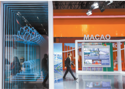
■11月5日,参会者走过中国馆澳门展区。

服务业开放更为突出。服务业已成为全球经济的重要支柱,世界服务业增加值占GDP的比重达2/3,全球服务贸易超过15万亿美元,增速远高于货物贸易。