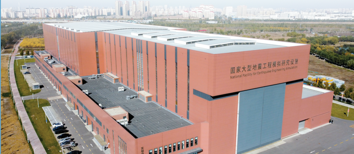
■国家重大科技基础设施“大型地震工程模拟研究设施”。