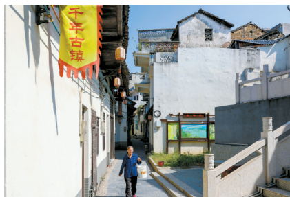
■星子社区保留比较完整的古民居。