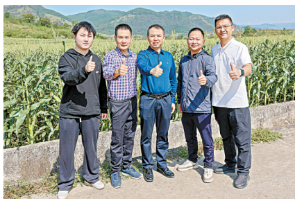
■广州市黄埔区驻清远连州市星子镇工作队合影。