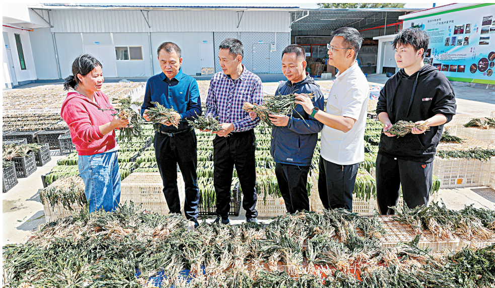
■驻星子镇工作队到山么妹公司调研农特产品生产、销售和联农带农等情况。