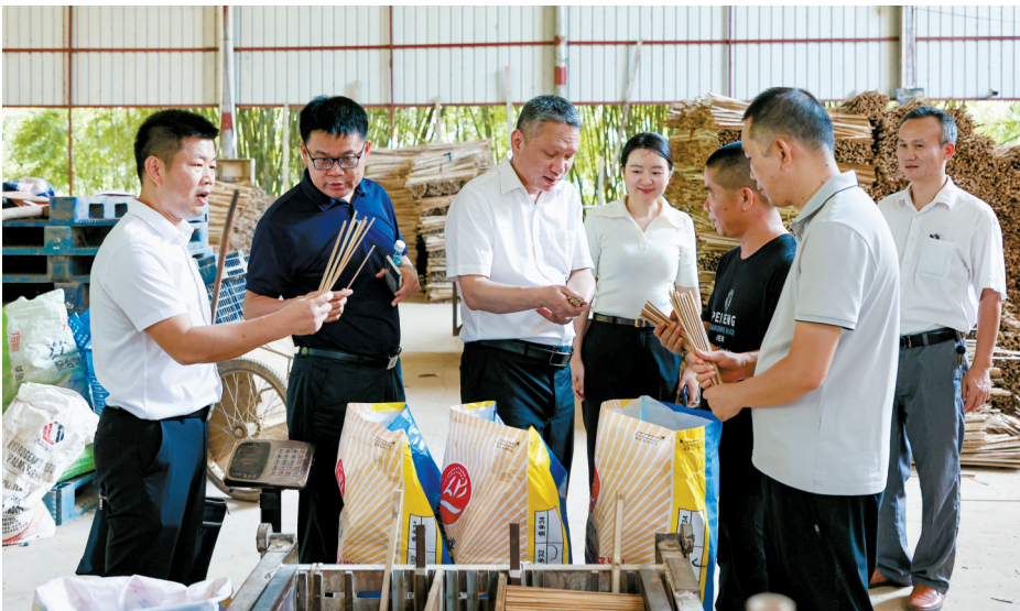
■组团单位佛山市交通运输局和驻永固镇工作队调研厘竹加工基地，了解企业发展和联农带农等情况。