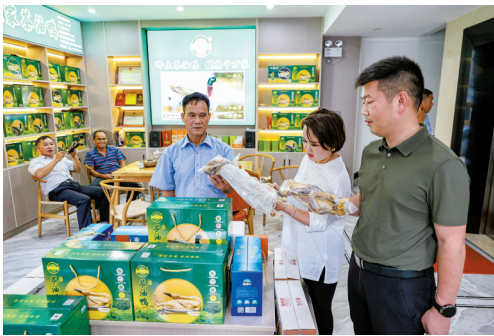
■驻永固镇工作队了解茶油鸭“土特产”的发展情况。