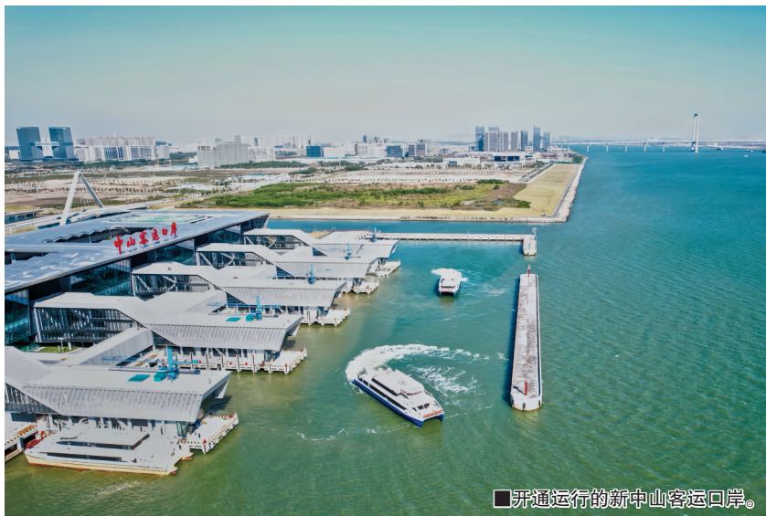
■开通运行的新中山客运口岸。

新中山客运口岸项目是广东省“十四五”口岸发展规划重点项目,将极大提升中山的交通便利性和对外开放水平,为中山经济高质量发展、推进“百千万工程”和中山对外文化交流和旅游合作带来新的机遇。