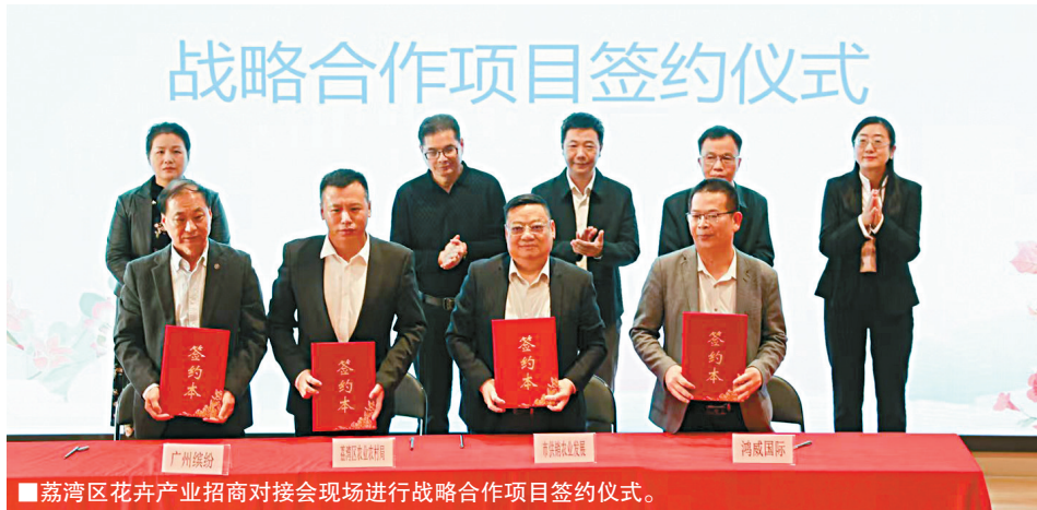
■ 荔湾区花卉产业招商对接会现场进行战略合作项目签约仪式。