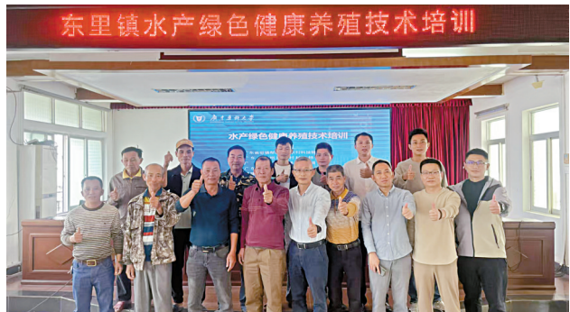
■ 水产绿色健康养殖技术培训现场。

新快报讯 记者朱清海报道 近日,在广州市驻湛江市雷州市东里镇帮镇扶村工作队(下称“工作队”)积极推动下,广东药科大学蔡延渠农村科技特派员团队在东里镇举办了水产绿色健康养殖技术培训会,镇村相关工作人员、农业专业合作社、养殖农户等近40人到场参加。