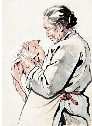
■《一辈子第一回》 杨之光 1954年 中国美术馆藏