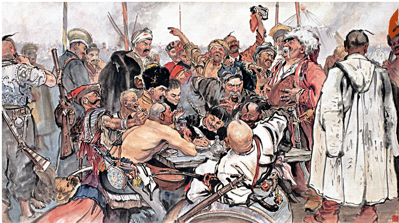
■临《萨布罗什人》杨之光 1954年 广州艺术博物院藏