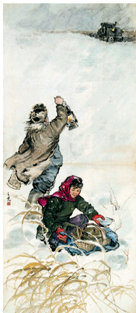
■《雪夜送饭》杨之光 1959年 广东美术馆藏

“杨之光对于水墨画的变革不仅体现在他努力将中国传统绘画的笔墨语言与西方绘画的严谨造型相结合，而且通过写意性的概括用笔，达到一种融笔墨与造型于一体的新写实中国画。”著名美术史家殷双喜认为，“我们在其代表作《矿山新兵》(1971年)中可以看到，这种生动明亮的笔墨表现与中国画特有的留白相结合，使杨之光的绘画获得了深远的空间，大大拓展了现代中国水墨画的空间表现力。”