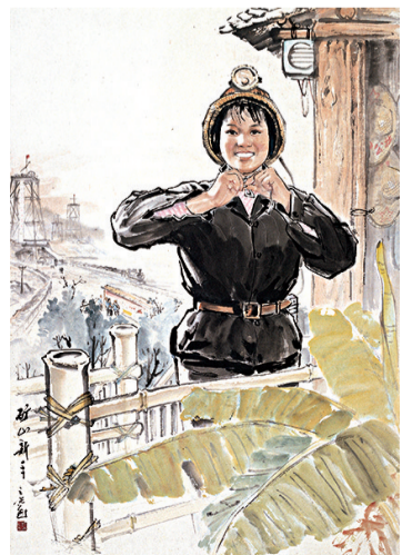
■《矿山新兵》杨之光 1971年 广州美术学院美术馆藏