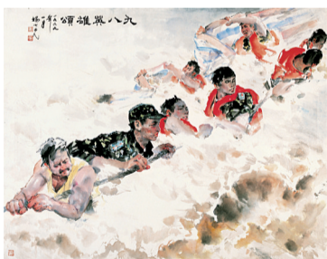
■《九八英雄颂》杨之光 1999年 广州艺术博物院藏