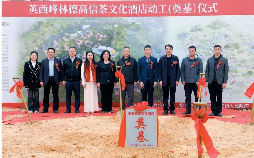
■参与活动的领导嘉宾现场合影。

红茶深厚的文化底蕴与英西峰林独特的自然风光完美融合,将为游客带来全新的旅游体验和文化享受,同时也将带动当地经济的发展和文化的繁荣。