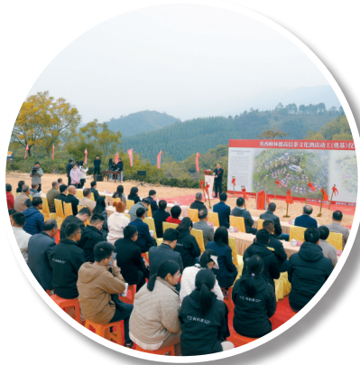
■12月27日,德高信茶文化酒店动工仪式在清远英德市黄花镇三山村德高信茶园举行。

下一步,黄花镇将激活明迳倒映、彭家祠古堡、永丰古桥等历史人文景区,引入乐天游低空飞行基地,以及潜舍、满舍等一批精品乡村酒店、乡村民宿,发展壮大农文旅产业……迎着“百千万工程”春风,黄花镇抓住产业这个根本,围绕打造山水风光特色小镇目标定位,把规划图逐步变成施工图、实景图,书写茶韵峰林、浪漫黄花的新篇章。