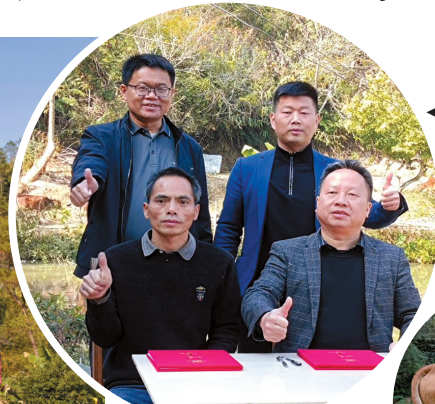
◀合作双方代表合影。