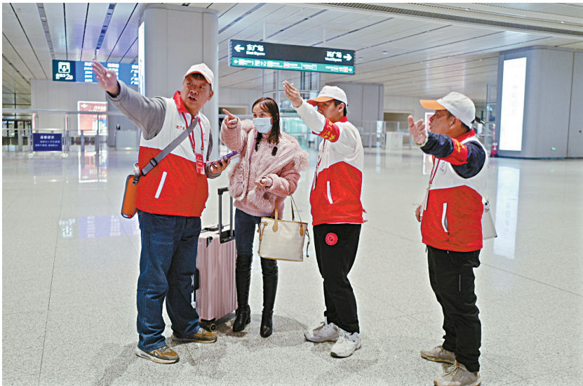
■应急组志愿者身背“流动AED”巡逻,遇到旅客求助协助解决问题。

“大家别在这里看了,这个屏幕是到达班次的信息。”在西广场入口,不少从地铁站出来的旅客都会习惯性停在大屏幕前查看车次信息,林哥巡逻经过,连忙