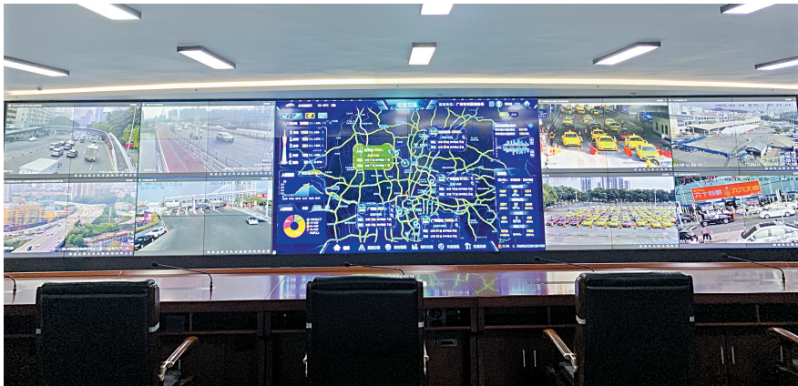
■汇集了广州市数据的“智慧交通”大屏。