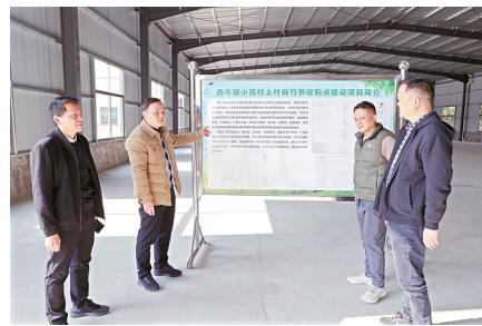
■工作队到小湾村上村麻竹笋收购点了解项目建设情况。