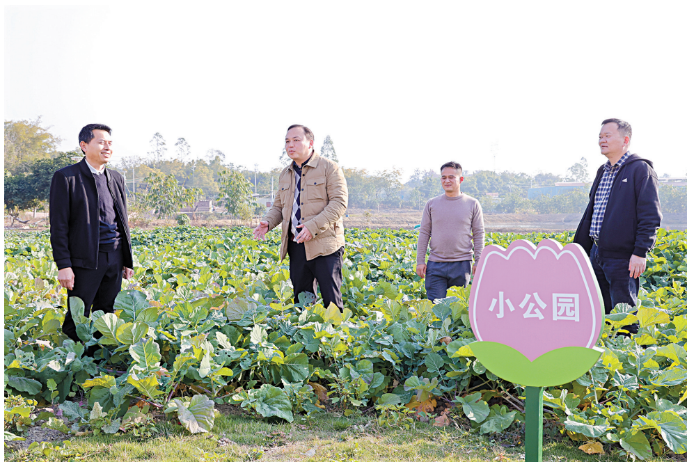
■驻西牛镇工作队到西联村了解帮扶项目实施情况。