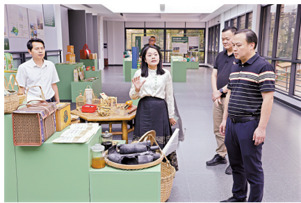
■工作队到西牛镇麻竹笋产业展示中心参观交流。