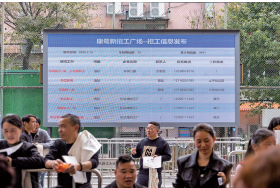
■海珠区康鹭新招工广场,LED显示屏轮播着招工信息,与手持手写信息的招工者形成对比。