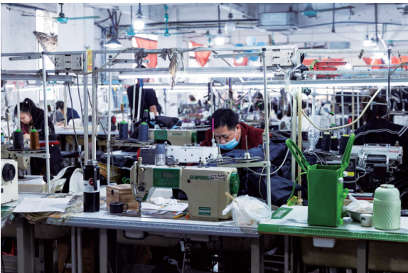
■虽也有一些家庭式作坊,但大塘村的制衣厂以中小型规模为主。