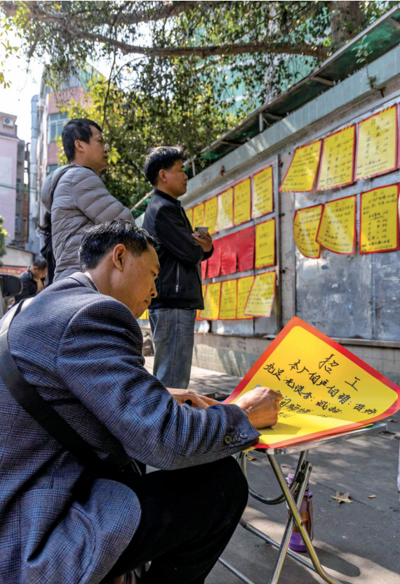
■一位负责招工栏信息的招聘者在招工栏下更新招工信息。