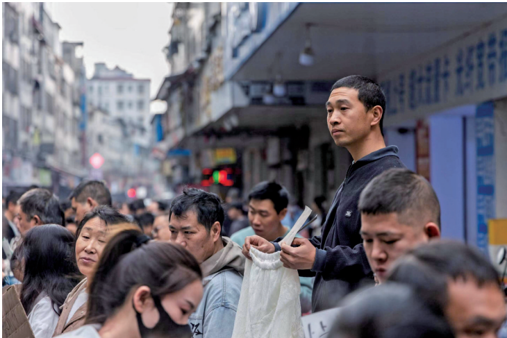
■这里也是市集,但交易的不是衣服,而是一天的辛劳。