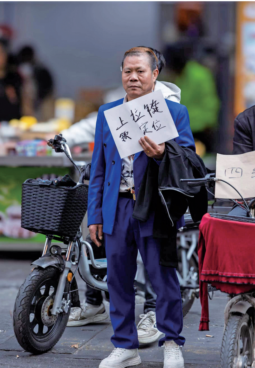
■“招工集市”上,一名制衣厂老板穿上亮色西装吸引目光。除了这身宝蓝色西装,他说自己还有粉色、红色、绿色西装,轮番上阵。