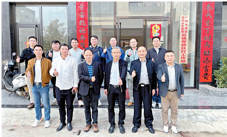
■三个工作队开展驻镇帮扶工作交流。