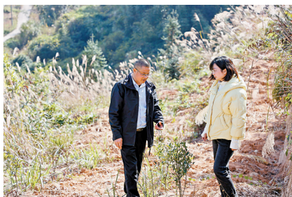
■位于太保镇上坪村内的陈皮柑种植基地内, 150亩山地已经种下了陈皮柑树苗。