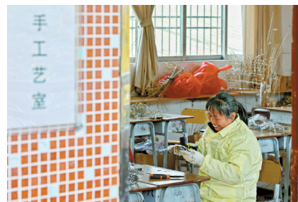
■基地通过免费彩扎技艺培训,有效带动农村劳动力特别是妇女实现就业增收。