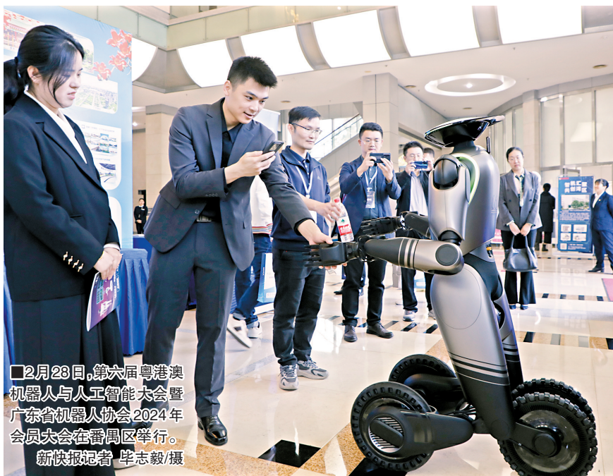
2月28日,第六届粤港澳机器人与人工智能大会暨广东省机器人协会2024年会员大会在番禺区举行。

新快报讯 记者谢源源 通讯员番宣报道 2月28日,第六届粤港澳机器人与人工智能大会在广州市番禺区举行。国内外顶尖机器人与人工智能精英汇聚湾区“智核”番禺,产学研深度融合、政企校携手共进,推动人工智能与机器人产业发展加力提速、成群成势,构筑高技术产业新支柱。