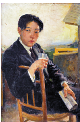
■ 自画像 油画 1924年