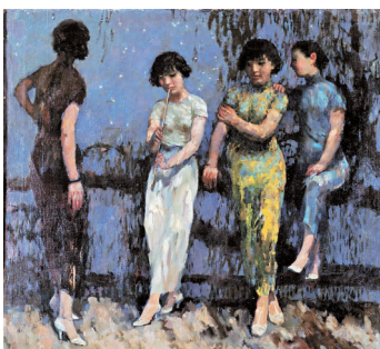
■ 月夜 油画 1931年