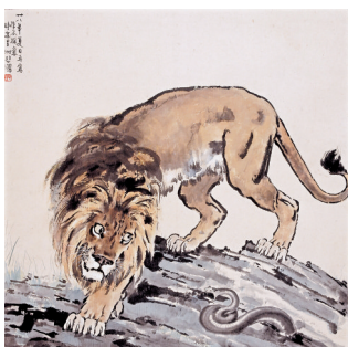
■ 侧目 中国画 1939年