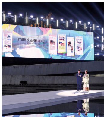
■广州首发空间指南1.0发布。