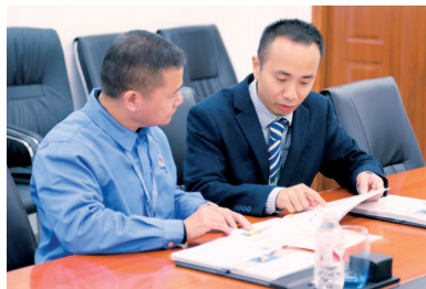
■邮储银行客户经理向半径电力总经理介绍金融服务。

支持民营经济发展是金融服务实体经济的内在要求。近年来,邮储银行广州市分行始终坚守初心,不断创新金融服务模式,加大对民营企业的支持力度,特别是在科技金融和普惠金融领域,持续聚焦先进制造业及关键核心技术,为民营企业的高质量发展注入强劲动力。