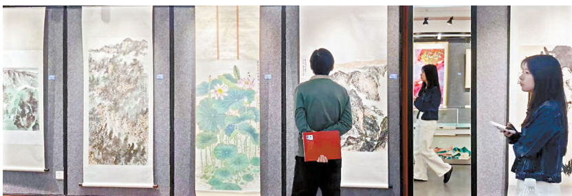
■广州青年美术作品邀请展(第二回)展览现场

本次展览策展人崔晓勇介绍,本次展出的作品,在色彩的激烈碰撞间,始终坚守“雅俗共赏”的审美追求,让传统与现代、高雅与通俗于此完美交融,都无不彰显着青年一代对艺术本真的执着探寻,以及对文化使命的自觉担当。(梁志钦)