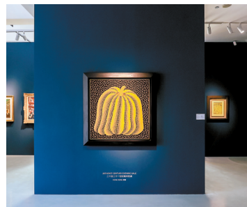
■佳士得2025年香港及上海春季拍卖即将开启。

3月28日及29日,佳士得将在香港举行一系列二十及二十一世纪艺术现场拍卖,呈现东西方现代及当代艺术杰作,随后将于4月3日在上海举行一场现场拍卖,精心挑选顶尖艺术臻品,以满足不同藏家的收藏品味。