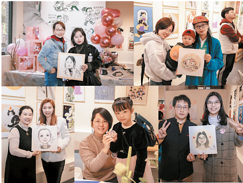
■漫画家们在展览现场为社区居民绘制漫画头像

本次展览共邀请了35位女漫画家,展出近50幅精品漫画作品,涵盖女性生活、工作、情感等多种艺术表达。这些作品以其独特的色彩韵味和意境之美,展现了女性艺术家对社会生活的深刻理解