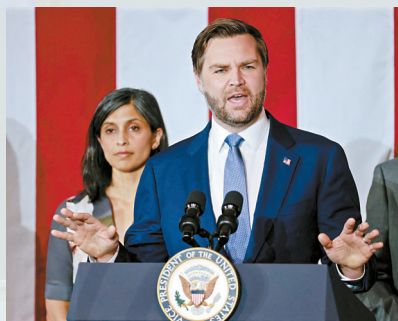
■3月14日,美国副总统万斯和妻子乌莎·万斯在美国密歇根州一场活动上。