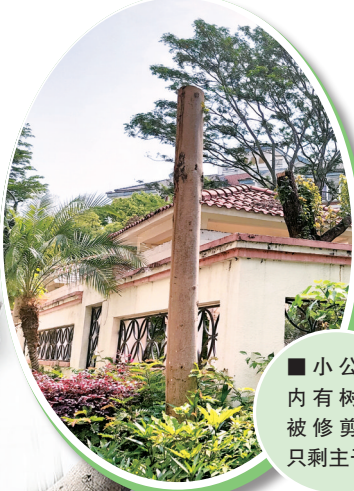
■小公园内有树木被修剪得只剩主干。