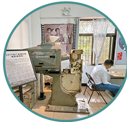
▲ 广州图书馆车陂广氮分馆并没配备自助借还机。

馆,广氮社区图书馆在设施设备方面存在不少短板,比如没有安装空调,没有提供Wi-Fi,也没有配备自助借还机,读者借还书需要由工作人员操作。