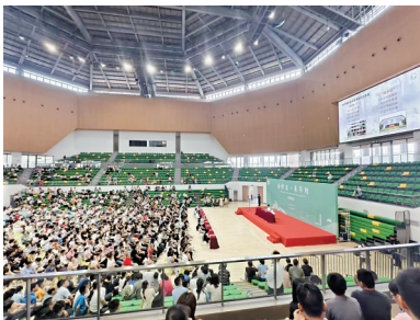
■华南师范大学附属中学体育馆内,家长和学生齐聚一堂,了解华附招生计划等。

“无体育,不华附。”开放日当天,华附新体育馆正式启用,受到学生和家长的关注。此前,华南师范大学附属中学