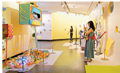
■广东美术馆 2025收藏童年系列展

4月30日,由广东美术馆主办、广州市越秀区大美术培训中心承办的“万语国:I&ME 广东美术馆 2025收藏童年系列展”在广东美术馆本馆开幕。