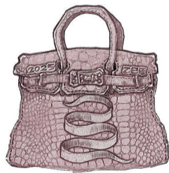
■陈志昕 版画《包罗万象 乙巳蛇年》

“2025年中国美协艺委会学术研究系列:小幅版画作品展览”日前在岭南美术馆启幕。本次展览汇集来自全国各地的315件版画力作,既延续了版画艺术“以刀代笔”的先锋战斗传统,又融入了对当代艺术的前卫表达,尽显艺术家们关于创作的崭新灵感和对时代的深刻思考。