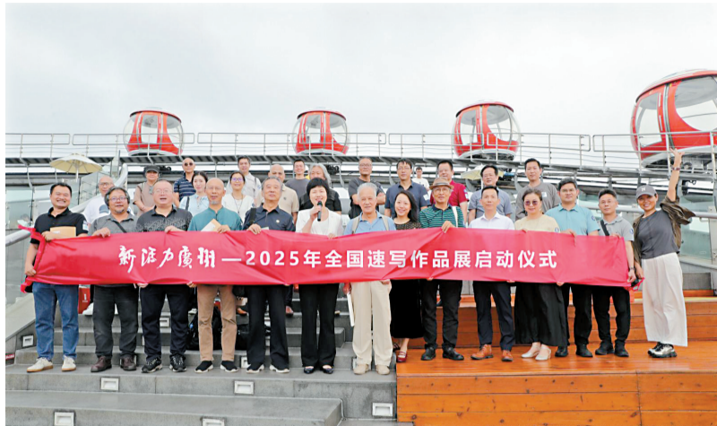
■新活力广州 2025年全国速写作品展启动

本次活动得到全国名家包括马振声、王永、王孟奇、方楚雄、卢禹舜、史国良、许钦松、李劲堃、张道兴、张春新、陈钰铭、陈永锵、周刚、范扬、林蓝、梁江、金城、赵准旺、蔡超的大力支持,纷纷应邀担任顾问。参加本次展览的作品内容要求健康