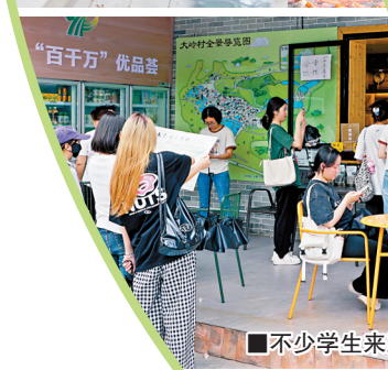
■不少学生来到大岭村研学。