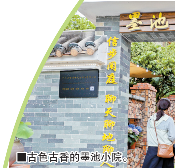
■古色古香的墨池小院。