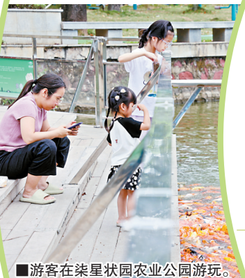
■游客在柴星状园农业公园游玩。