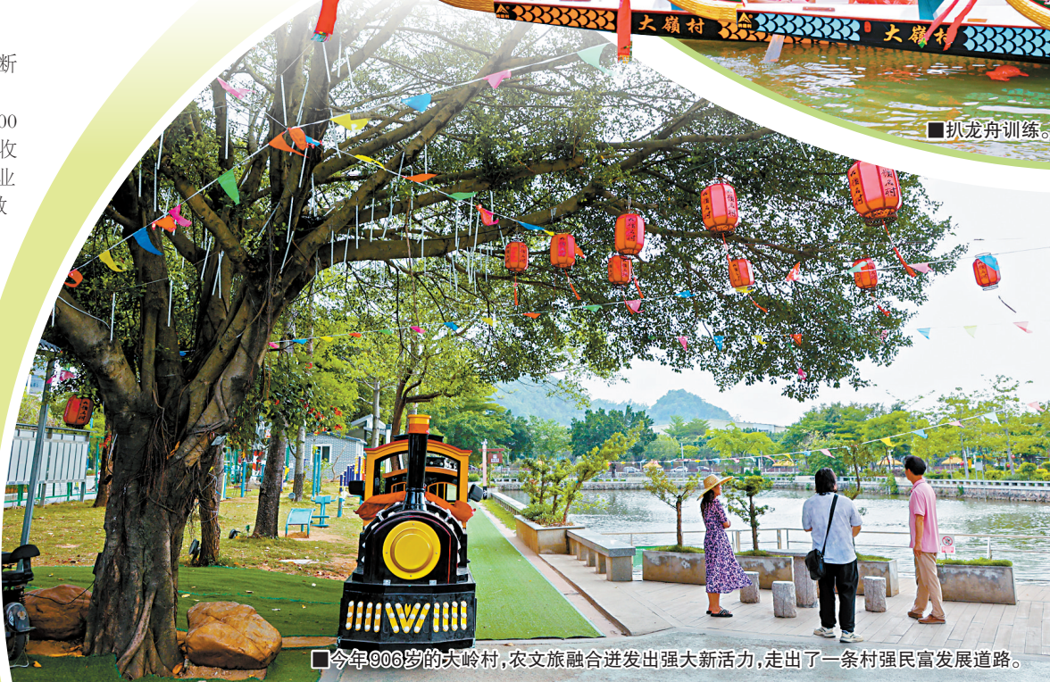
■今年906岁的大岭村,农文旅融合迸发出强大新活力,走出了一条村强民富发展道路。