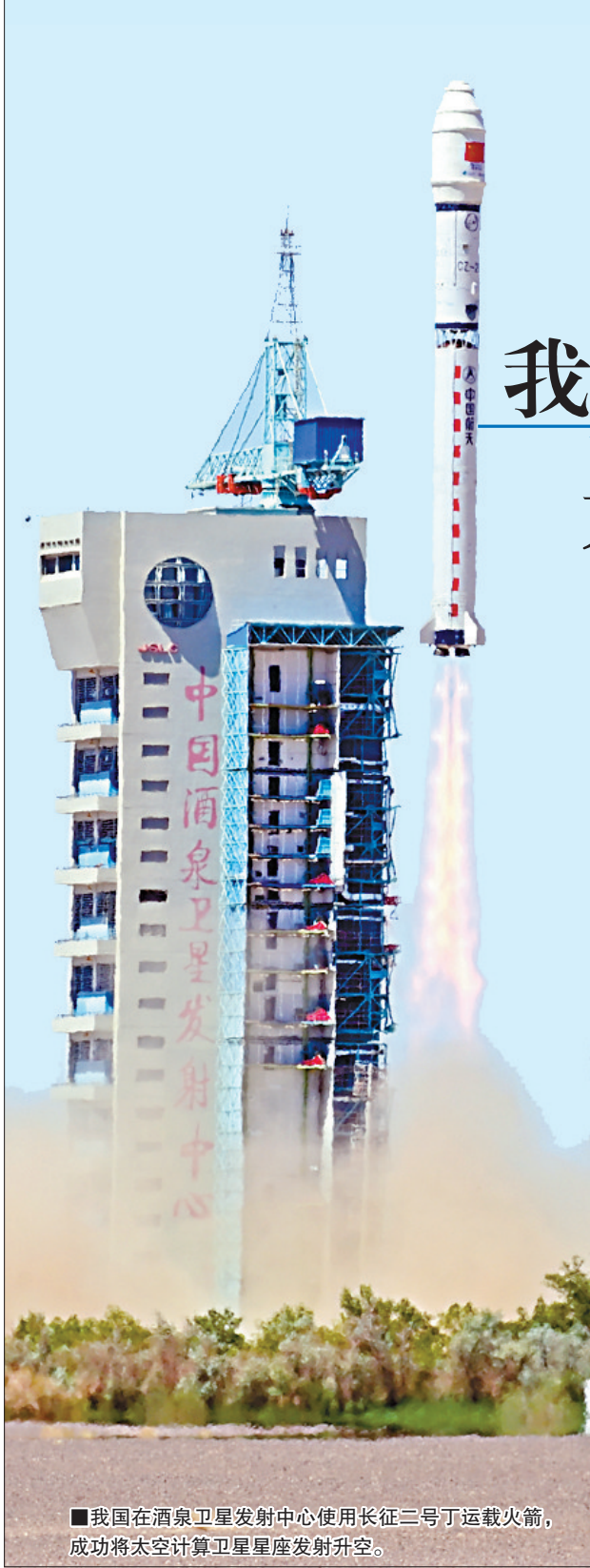
■我国在酒泉卫星发射中心使用长征二号丁运载火箭，成功将太空计算卫星星座发射升空。