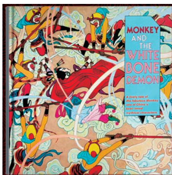
■英文版《西游记·三打白骨精》

《最美西游》的原版作品打破传统连环画具象表现桎梏,采用装饰绘画语言,汲取敦煌壁画、民间年画等传统艺术精髓,通过高度概括的造型设计和八层套色印刷工艺,构建出极具辨识度的视觉符号。五部作品中,孙悟空的灵动、唐僧的慈悲、妖魔的诡谲跃然纸上,每一帧画面都精彩绝伦,令人叹为观止。1984年《最美西游》的原版作品首次出版即引发轰动,其英文版更是输出海外,成为早期“走出去”的中国出版物之一。此后,该作品的分册如《三打白骨精》《真假美猴王》先后入选第六届、第七届全国美术作品展,奠定了其在中国近代连坛上的巅峰地位。