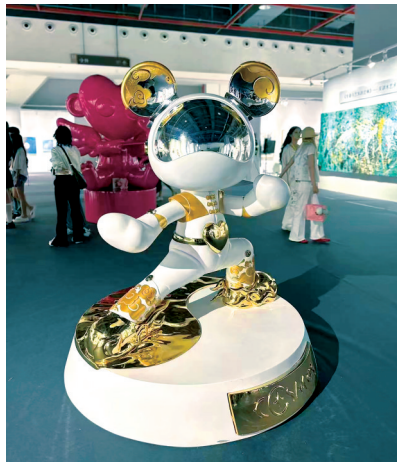
■2025广东国际艺术周展览现场。