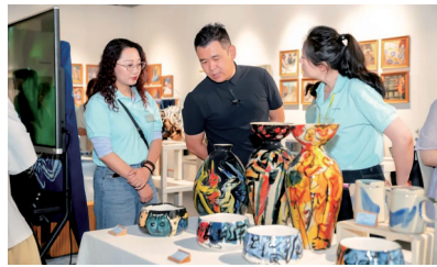
■JOYYE卓艺陶瓷艺术生活的艺术联名单元。